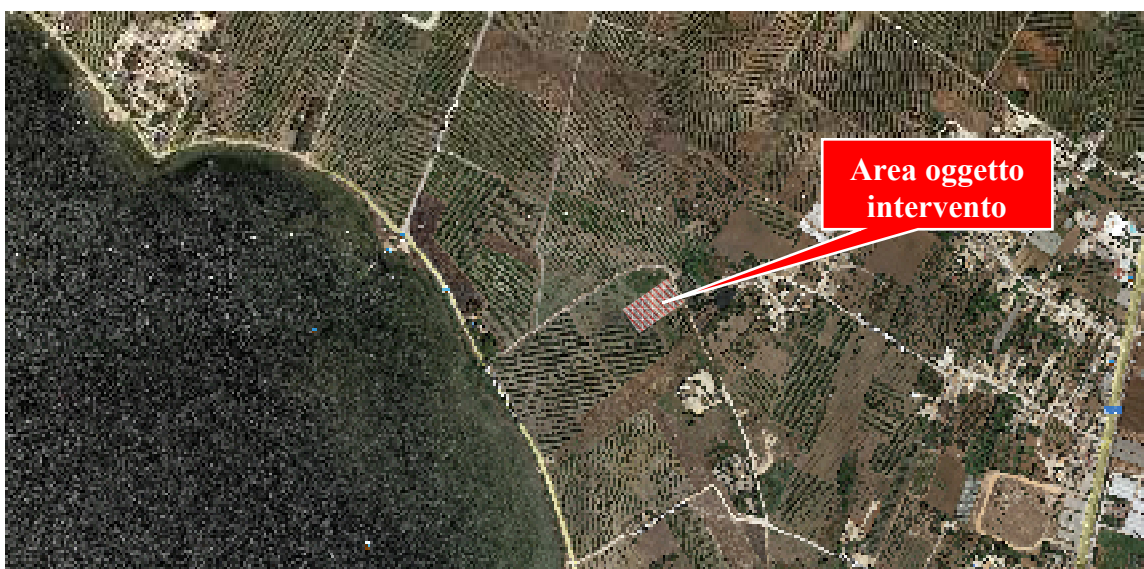
Fig. 2 - Ortofoto, in rosso Area oggetto di intervento