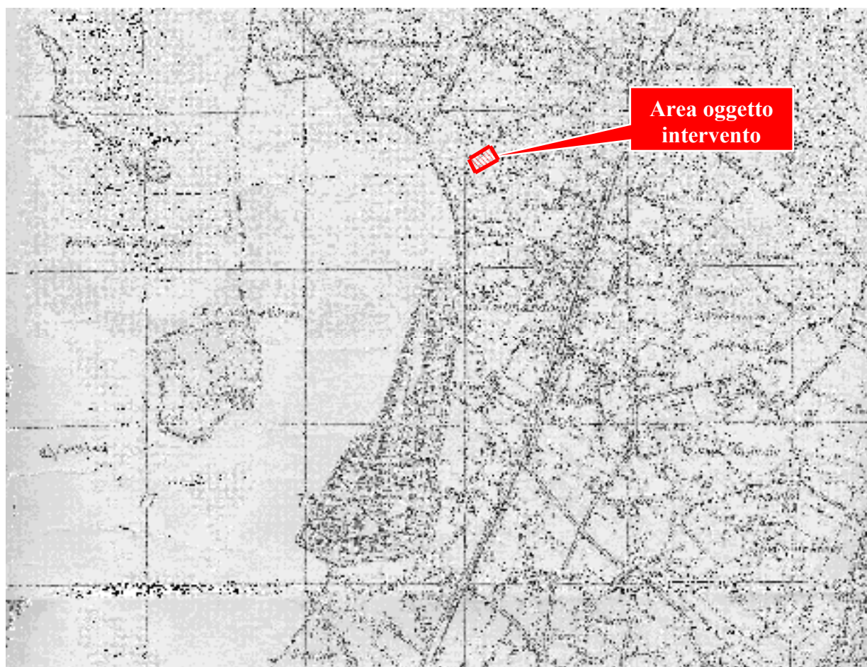
STRALCIO I.G.M. – Scala 1:25000, in rosso immobili oggetto di intervento.