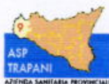
ASP TRAPANI AZIENDA SANITARIA PROVINCIALE