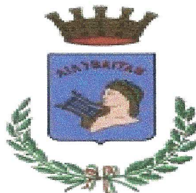
Città di Marsala