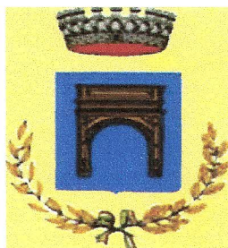
Città di Petrosino