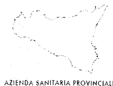
AZIENDA SANITARIA PROVINCIALE